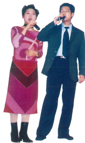
业务发展部情歌对唱《相思风雨中》