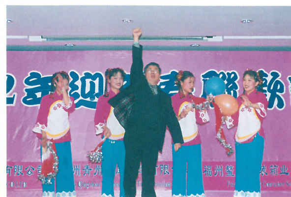
操作部舞蹈《花开四季》(荣誉奖)