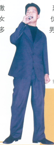
安监保卫科独唱《永远》

“女生版的F4组合”身着红色紧身装上衣和黑色皮裤的三位美少女在T型台上出现的时候，全场的喝彩声此起彼伏，煽情万分——这就是财务部5分钟劲舞《颜色》。变幻莫测的灯光效果，激烈的舞曲伴随着优美的舞姿让公司许多男性“芳心”大动！