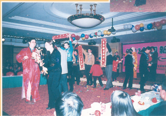
行政人事部歌舞表演《恭喜恭喜》(优秀奖)