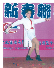
业务发展部爵士舞《荣誉奖》