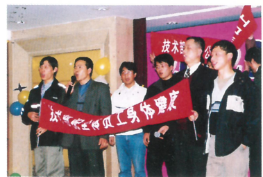
技术部合唱《弹起我心爱的土琵琶》