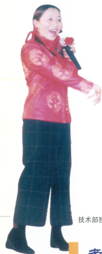
技术部独唱《回娘家》