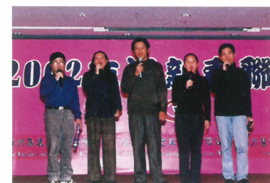
资讯科合唱《新春报喜》