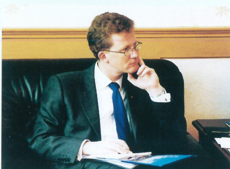
2月28日,英国驻广州总领事STEPHEN LILLIE(李丰)先生来到青州港区参观考察